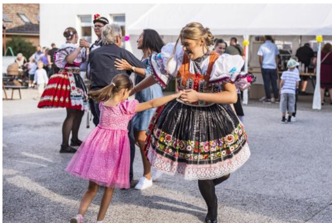
Hodovali nejmladší i nejstarší hodovníci

Ve dnech 23. - 25. srpna se konaly „Tradiční Bartolomějské hody“. Vše začalo sobotní odpolední „stárkovskou“ mší v kostele, po které začal prů-