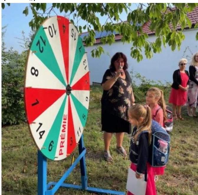
Zahájení školního roku

V upomínku na tento významný den jim paní starostka za Obecní úřad Křepice předala krásný knižní dárek. Nakonec jsme všichni přešli do budovy školy, kde jsme už tradičně pro naše prvňáčky připravili „první zvonění“.