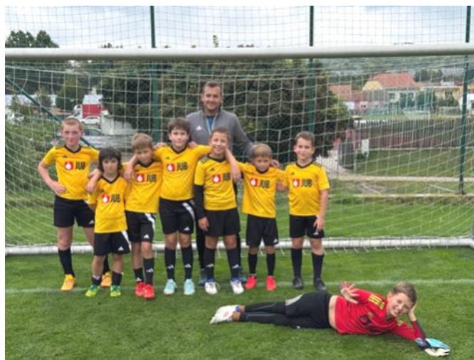
Naši nejmladší fotbalisté

Máme také družstvo přípravky, které hraje turnaje „Žijeme hrou“ pod OFS Břeclav. První turnaj v