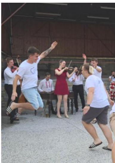
Došlo i na verbuňk

Většina z nás si během let zvykla na příjemné odpolední setkání u cimbálu o sobotních Křepických hodech v prostorách „hájenky“. V letošním roce se děvčata a chlapi z pořádajícího spolku „Křepická chasa“ rozhodli jinak - a cimbálovou muziku „Lusk“ pozvali již týden