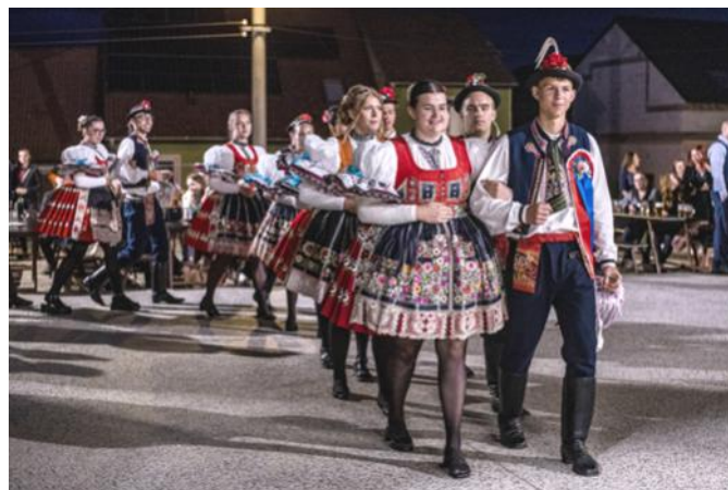
Tradiční pochod stárků

Nedělní program začal zvaním po obci ve 12:00, odpoledním posezením s kapelou v 17. hodin a večerní zábavu. Odpolední posezení s kapelou se vydařilo, počasí tentokrát přálo. Uspořádali jsme dětské sólo, které si jak děti tak i stárci užili a místo mašličky byly odměnou bonbóny. Ve 20:00 začala