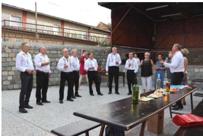
Mužáci rozezpívali návštěvníky

atmosféru. S cimbálem jsme zapívali do podvečerních hodin, někteří si po té notovali i bez hudební-