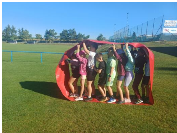
Projekt Den bez úrazu

První školní týden byl pro všechny spíše rozjezdový. Děti se postupně vracely do školního rytmu - sdílely si své prázdninové zážitky, společně si nastavovaly školní pravidla a užívaly si čas se spolužáky. K posílení vzájemných vztahů přispěl i projektový den s prvky prevence „Den bez úrazu“, který dětem hravou formou připomněl, jak se chovat