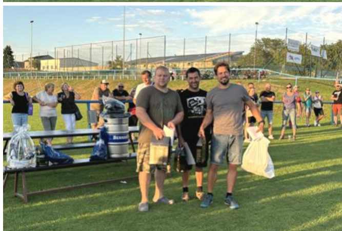
A nejlepší guláše navarili...