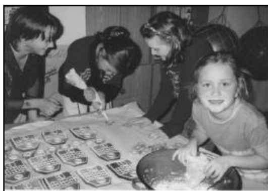
Přípravy na zápis ve školní družině vrcholí.