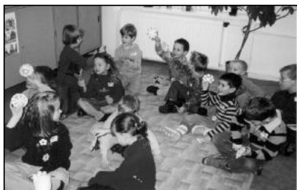
Při zápisu děti společně plnily různé úkoly.

Druhé pololetí jsme zahájili přípravou na zápis do 1. třídy ZŠ, který byl letos připraven zase jinou netradiční hravou formou. Všichni předškoláci byli šikovní, dobře spolupracovali a prokázali, že jsou na první třídu dostatečně připraveni. Rodiče i učitelky z MŠ mohou být na své děti pyšní. Příští školní rok tedy přivítáme v naší škole 13 prvňáčků.