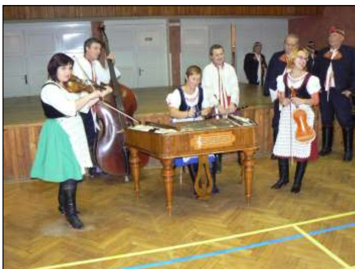
Tradiční posezení u cimbálu