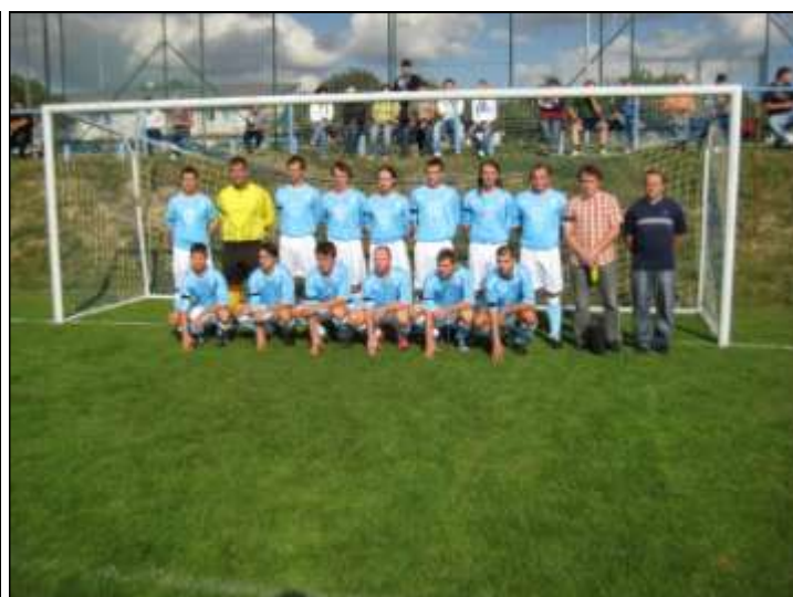
Nové dresy prvního mužstva