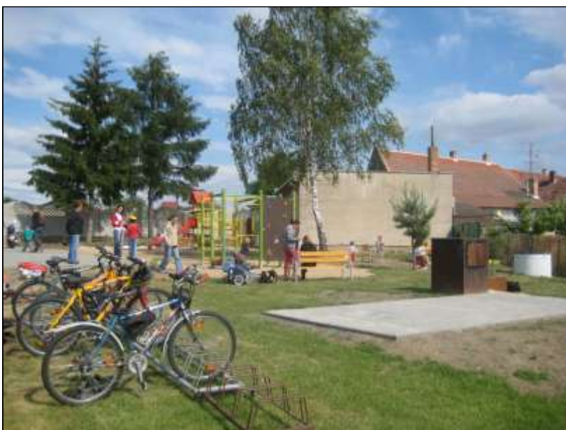
Dětské hřiště v areálu TJ Sokol

Mnohem větší respekt vzbuzují svými výkony mladší žáci. Jsou sice nováčky soutěže, ale stal se z nich pro všechny obávaný soupeř, se kterým není radno si zahrávat. Některé své vrstevníky přehrávali výrazným rozdílem. Ve Velkých Pavlovicích rozprášili své protihráče 7:0. Z Tasovic, kde hráli pouze v deseti, si odváželi plný počet