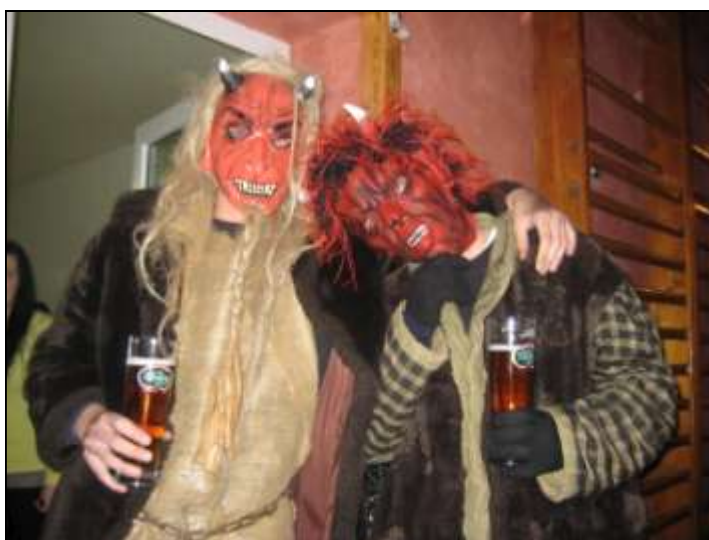
Mikulášská zábava pořádaná TJ Sokol Křepice