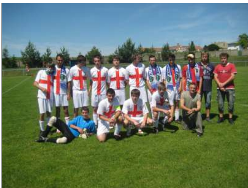
Dorost odměna odcházejícím a 1. mužstvo 14.6.09

Těžká bitva čekala mužstvo v Krumvíři. Případným vítězstvím jsme mohli domácí přeskocit v tabulce. Krumvířští se však, stejně jako v několika předešlých ročnících, pokoušejí postoupit do vyšší soutěže a nikomu nic neda-