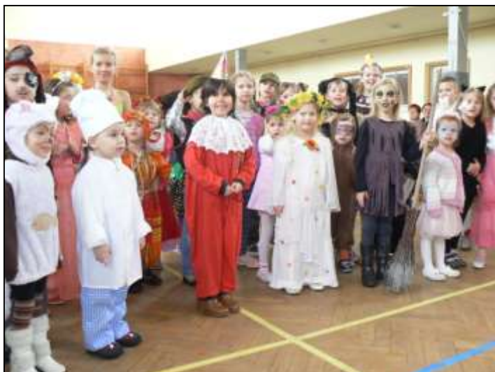
Dětský maškarní bál