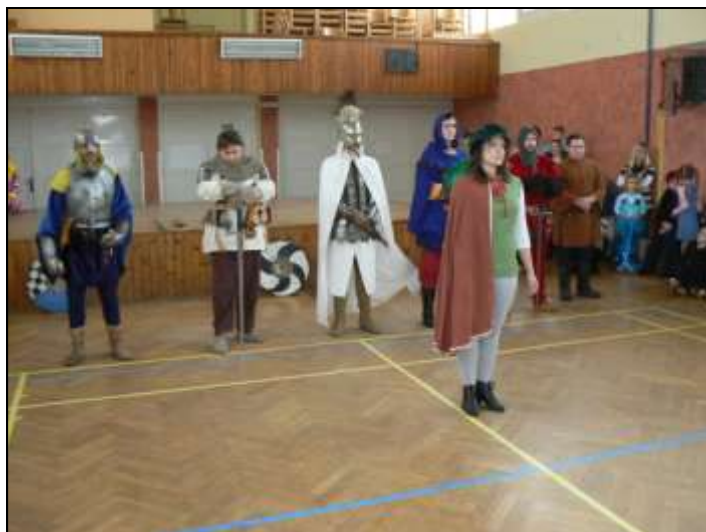
Vystoupení šermířů na dětském maškarním bále