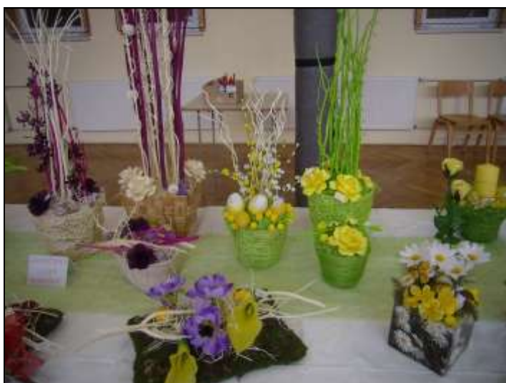
Velikonoční dílny a vítání jara ZŠ Křepice