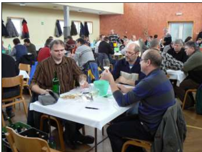
Bodování před výstavou vín