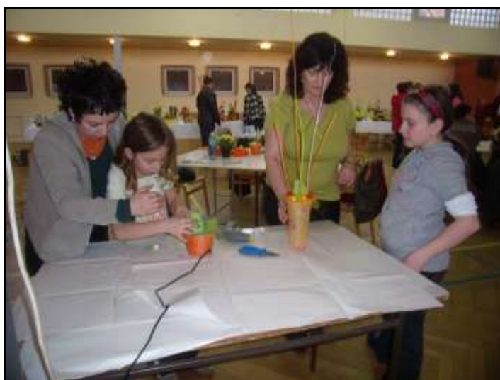
Velikonoční dílny a vítání jara ZŠ Křepice