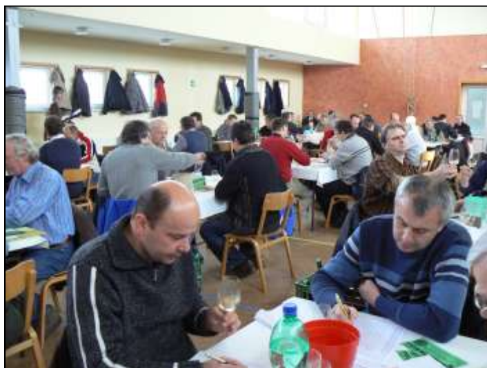
Bodování před výstavou vín