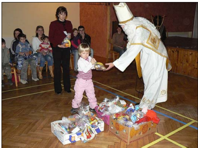
Mikulášská besídka mateřské školy