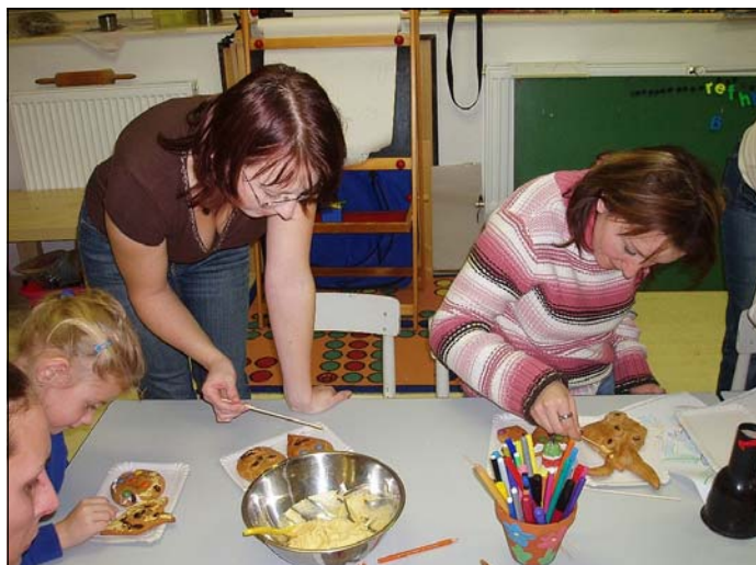
Mikulášské dílničky v mateřské škole