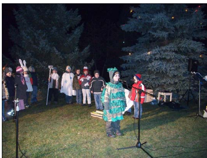
Adventní zpívání u vánočního stromu