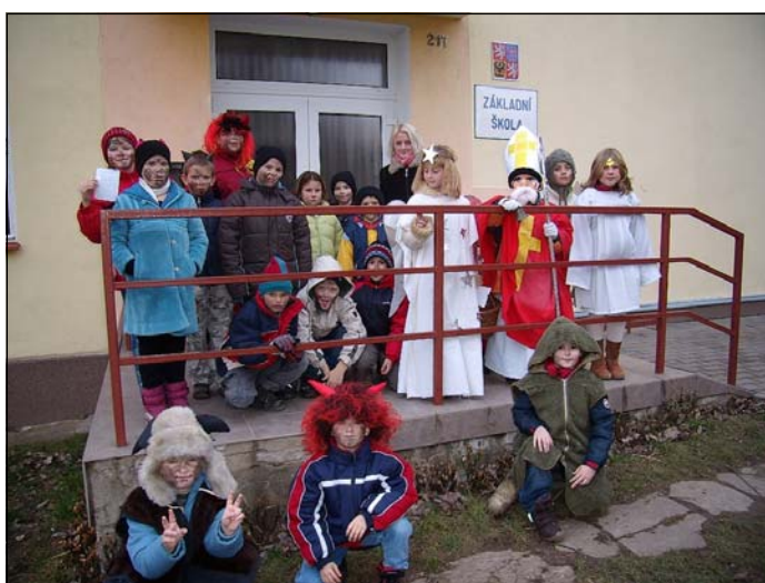
Mikuláš byl i v základní škole