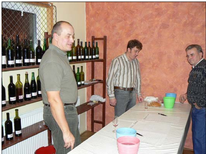
Zahradkářské Posezení u cimbálu