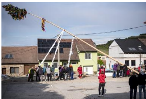
Tradiční stavění máje

V pátek 16. května proběhlo tradiční stavění máje na placi u obecního úřadu. Stavěli jak stárci,