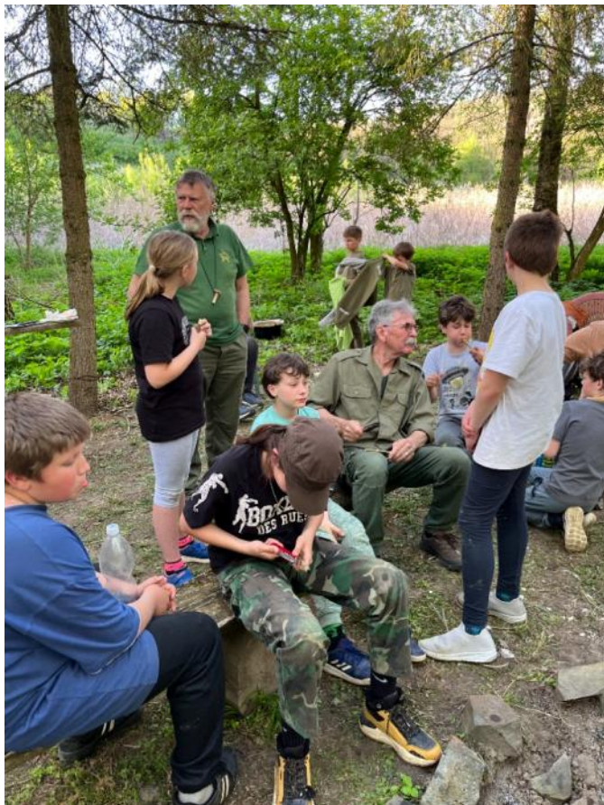
Den Země s naučnou stezkou