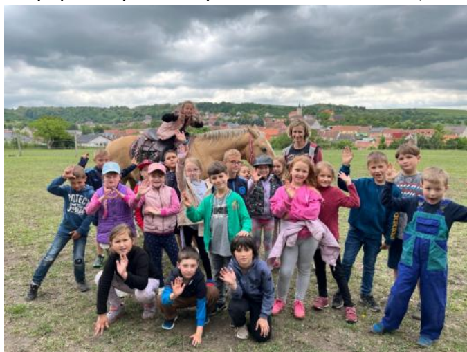
Školní družina na návštěvě u koní

Odměnou za celoroční práci byl pro všechny žáky společný školní výlet do lanového centra, kde