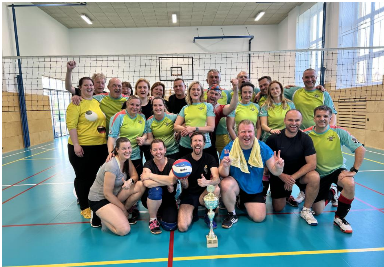
Přátelské utkání volejbalových týmů Křepice a Zakřany