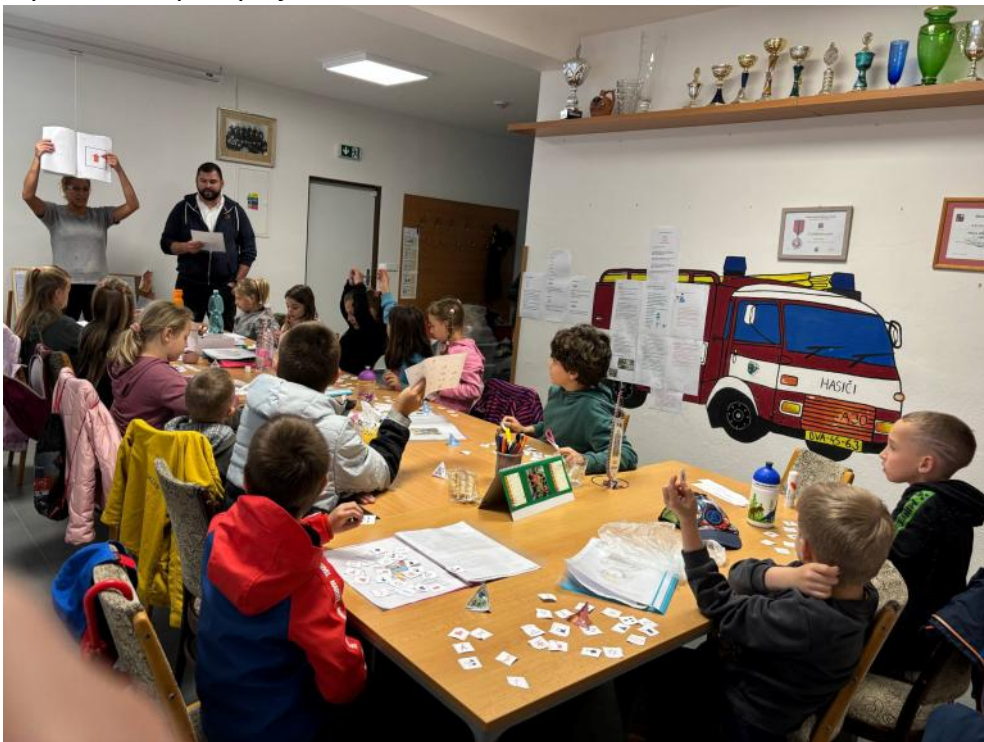
Hasiči se scházejí v hasičské zbrojnici na pravidelných schůzkách

Přes letní prázdniny kroužek není, ale sejdeme se znovu v září. Před tím ale ještě, než se rozprchne na prázdniny, nás čeká rozlučkový táborák, kde nebude chybět opékání