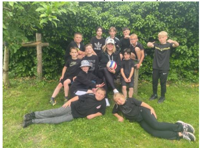
Naši vítězové ve vybíjené

Protože jsme škola venkovská, obklopená přírodou, nezapomínáme na ekologii. Celoročně jsme děti motivovali k chození pěšky do školy, k třídění