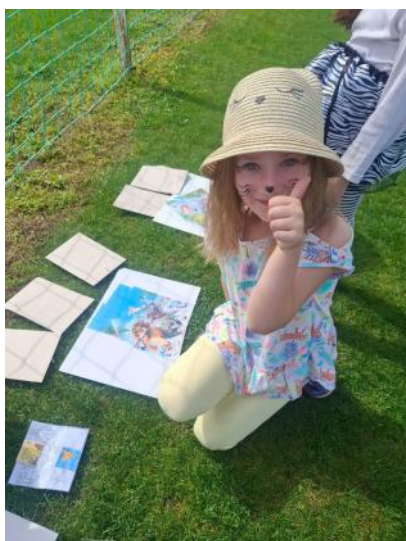
Slavili jsme Den dětí

V dubnu si předškoláci zašli na návštěvu do družiny a první třídy, aby se podívali, jak se jejich kamarádi učí a jak se zabaví odpoledne. Třída Včeliček a Mravenečků si zajela do Brna do Planetária na pohádku Se zvířátky o vesmíru. Před velikonoce jsme pozvali rodiče do školky na jarní a velikonoční vyrábění,