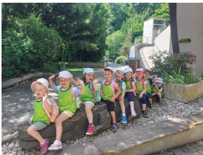
V červnu jsme navštívili ZOO v Jihlavě

Poslední akcí je rozloučení se školním rokem a pasování předškoláků na školáky. V letošním ro-