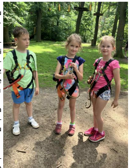
Výlet do lanového centra v Břeclavi

odpadu, tvoření z odpadového materiálu, sběru pomerančové kůry, na jaře pak ke sběru květů černého bezu, k péči o naši školní zahradu a dalším aktivitám, které vedou děti k ohleduplnosti vůči přírodě. Moc si vážíme pomoci těch z vás, kteří se do sběru pomerančové kůry a květů černého bezu zapojili s námi.