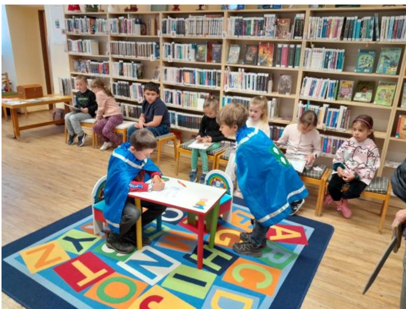
Pasování prvňáčků na nové čtenáře

nachystala jejich paní učitelka, že umí číst a tak jsme je naposovali na nové čtenáře. Chceme je pochválit, protože mnozí z nich svou průkazku již využili k půjčování knížek. Do knihovny zavítali i žáci 4. a 5. třídy ZŠ, kteří se zábavnou formou seznámili s nářečím. Obě knihovnice se zúčastnily v ZŠ besedy s autorkou K. Smolíkovou a pro děti nakoupily další její knížky, které