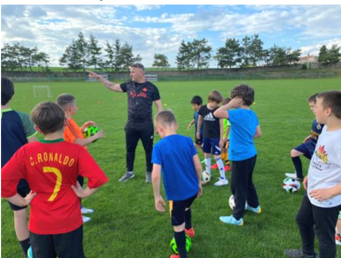
Příprava křepických fotbalových nadějí

Na začátku jarního klání nás nemohl čekat nikdo