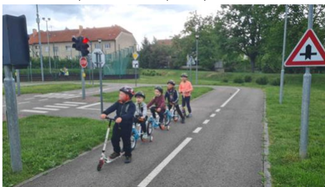
Předškoláci si zajeli na dopravní hřiště

Předškoláci podnikají v těchto krásných slunečných dnech různé výlety. Zajeli si na dopravní hřiště do Hustopečí. Podnikli pěší výlet k Nikolčickému