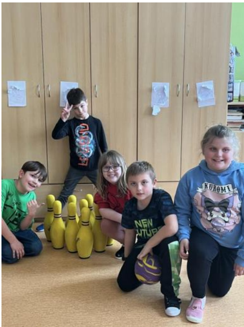
Kuželkiáda ve školní družině

Ani jsme se nenadáli a další školní rok se blíží ke svému konci. Čas utekl jako voda a my se teď s malým ohlédnutím vracíme k poslednímu čtvrtletí, které bylo v naší škole naplněné pestrým programem, společnými zážitky a radostí z objevování nového. Děti i pedagogové se zapojili do celé řady